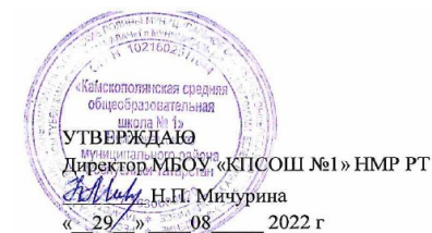
График проведения оценочных процедур обучающихся начальной школы на 2 полугодие 2022-2023 учебного года